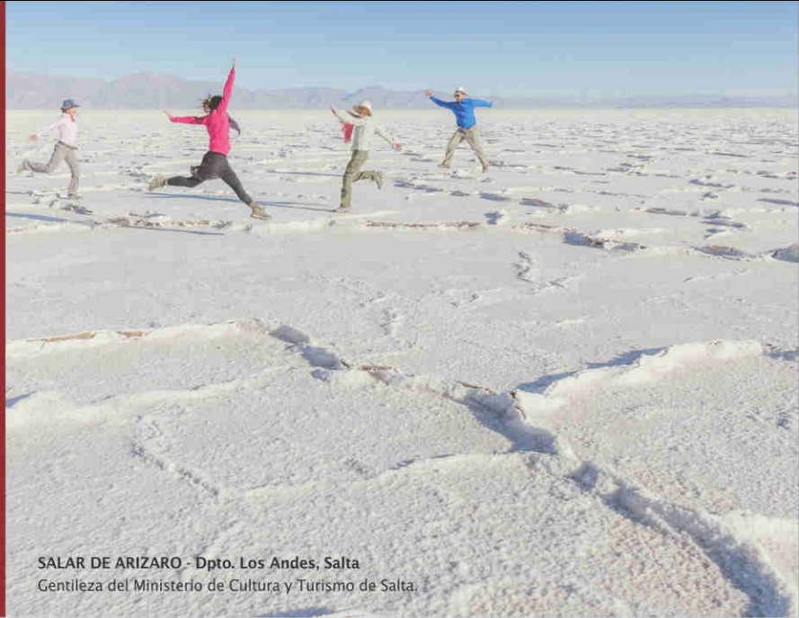
SALAR DE ARIZARO - Dpto. Los Andes, Salta