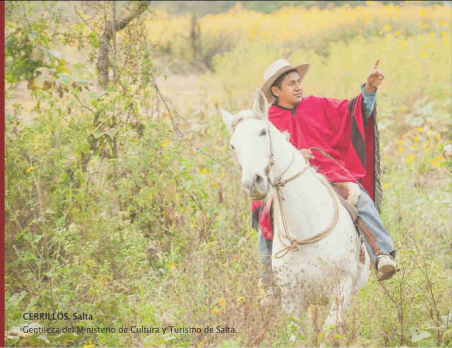
CERRILLOS, Salta