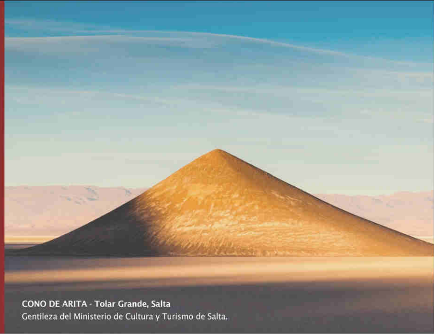
CONO DE ARITA - Tolar Grande, Salta