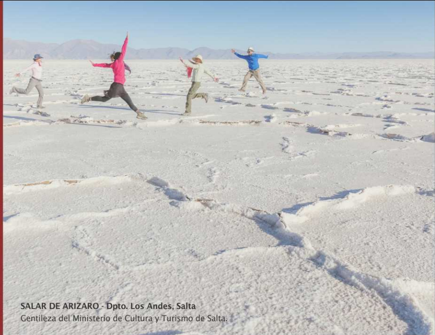
SALAR DE ARIZARO - Dpto. Los Andes, Salta