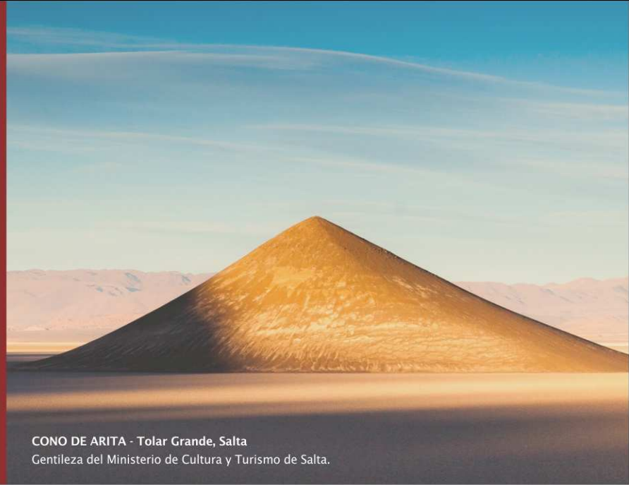
CONO DE ARITA - Tolar Grande, Salta