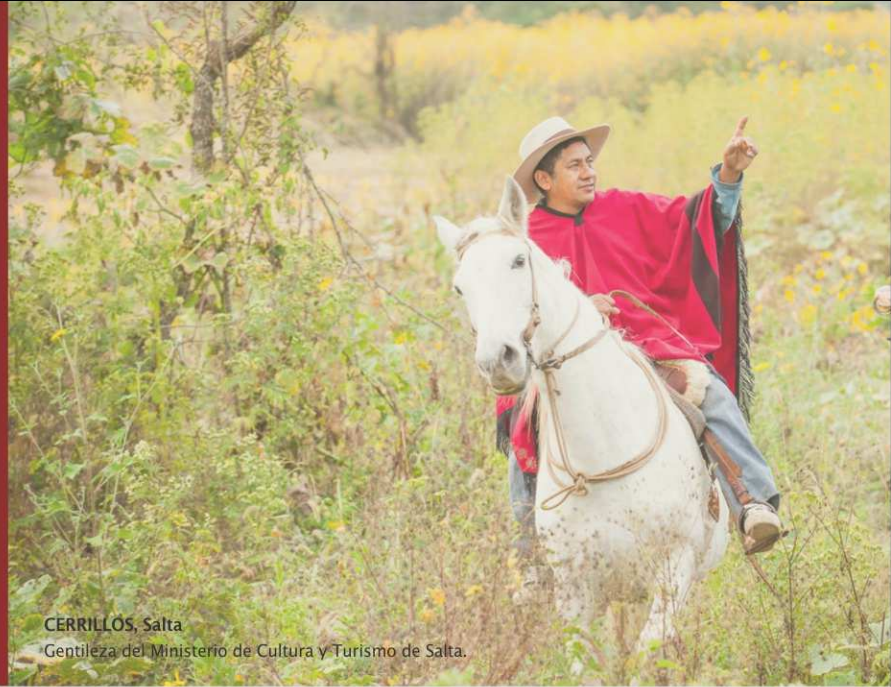
CERRILLOS, Salta