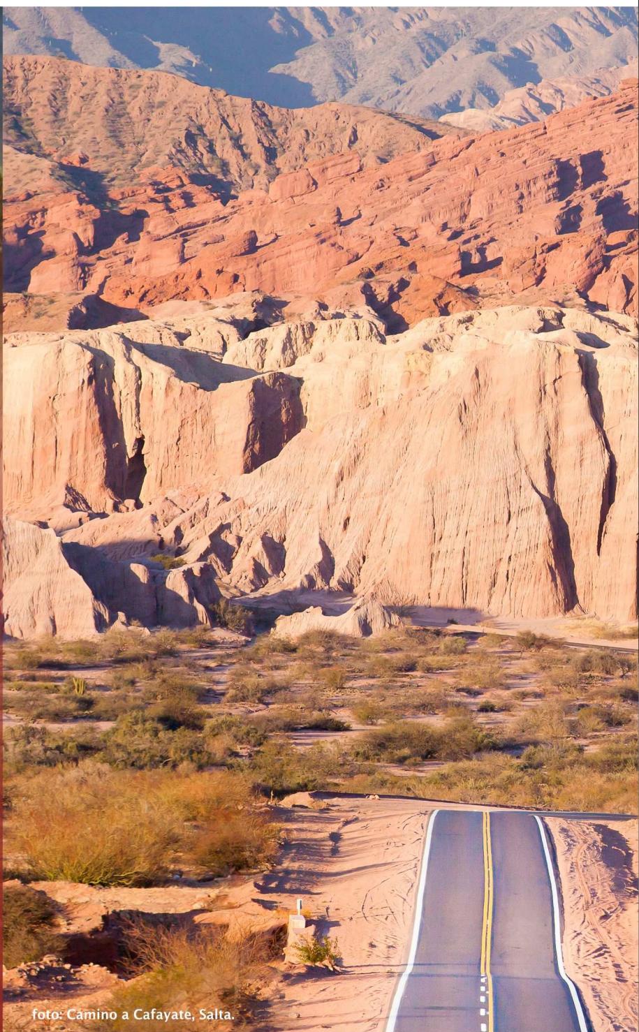
foto: Camino a Cafayate, Salta.