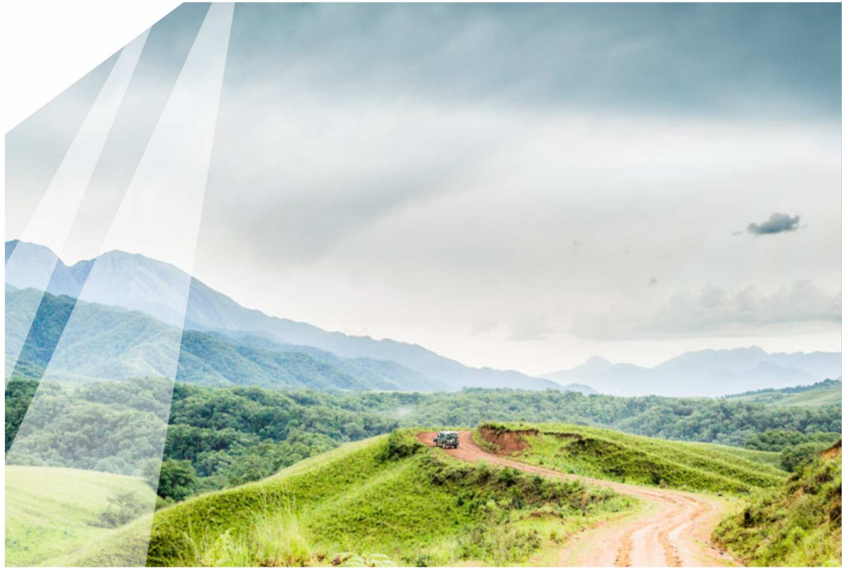
Parque Nacional Baritú - Salta