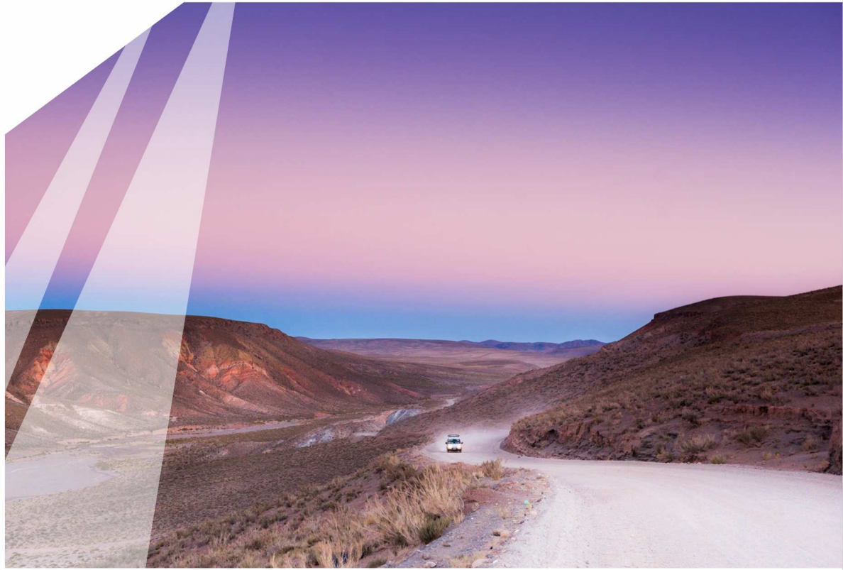
San Antonio de los Cobres - Salta