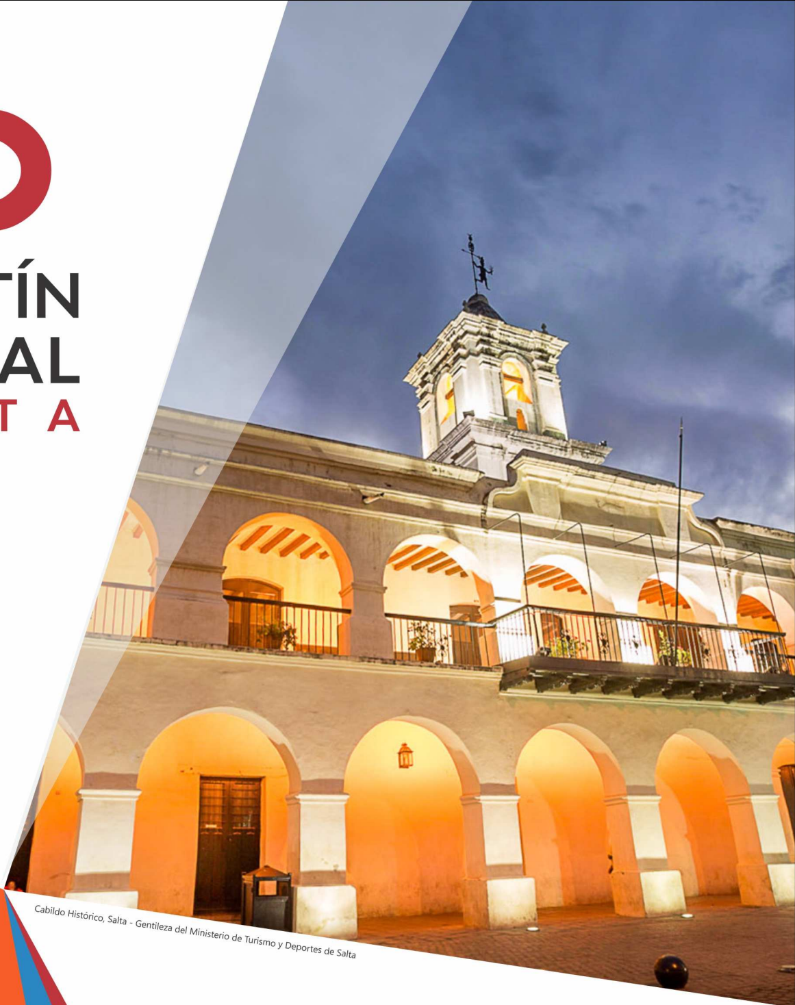
Cabildo Histórico, Salta