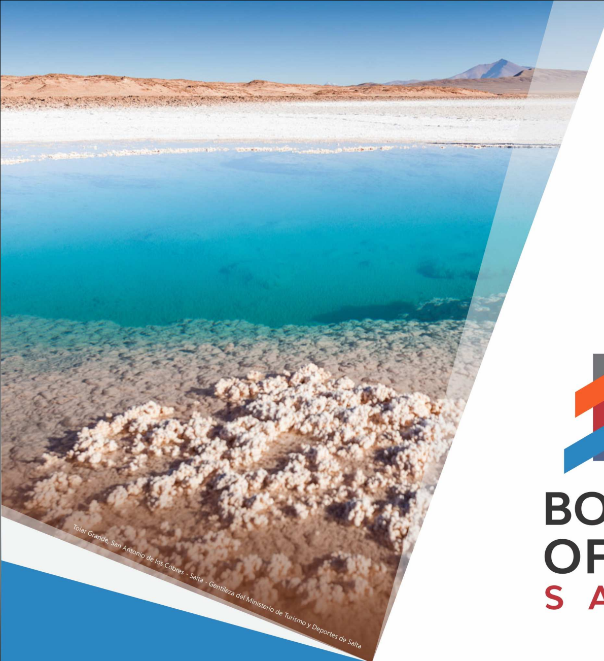
Tolar Grande, San Antonio de los Cobres - Salta