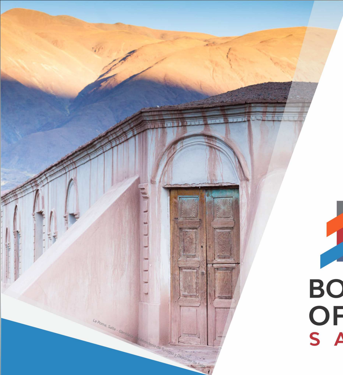
La Poma, Salta