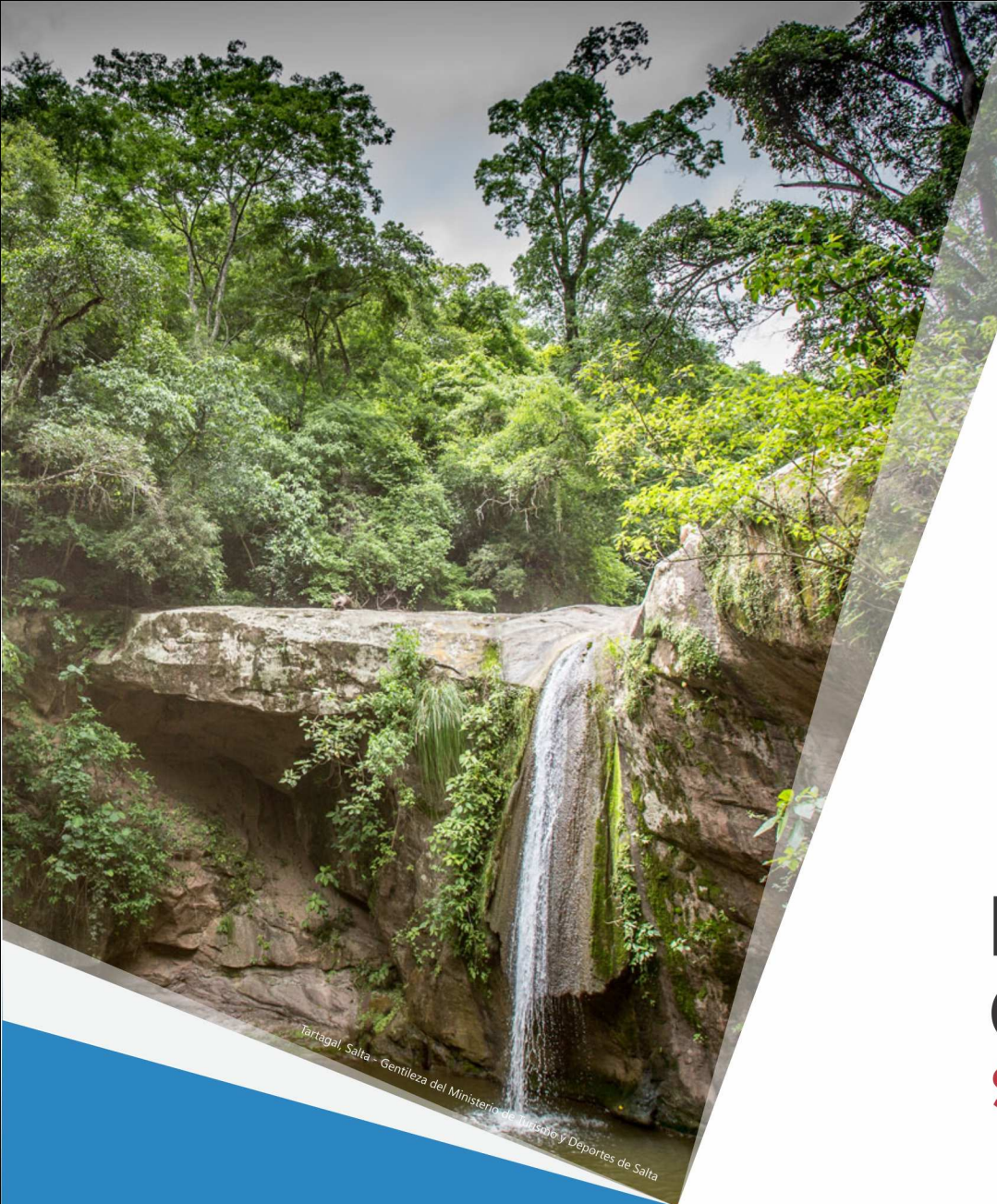
Tartagal, Salta