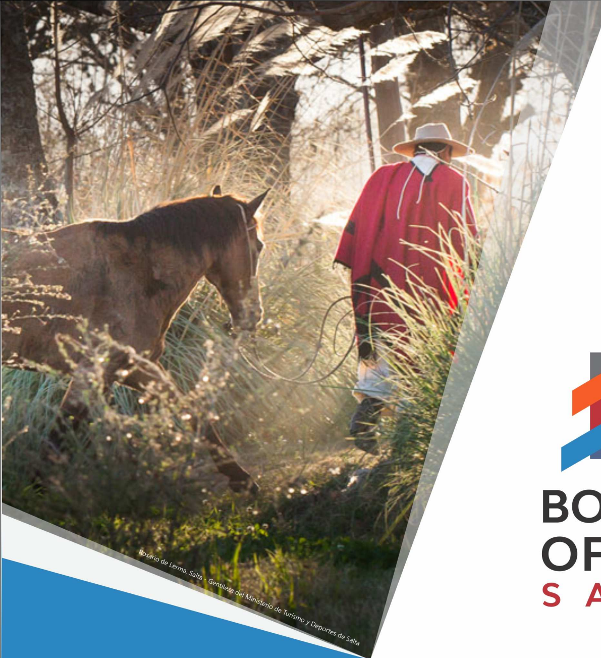
Rosario de Lerma, Salta