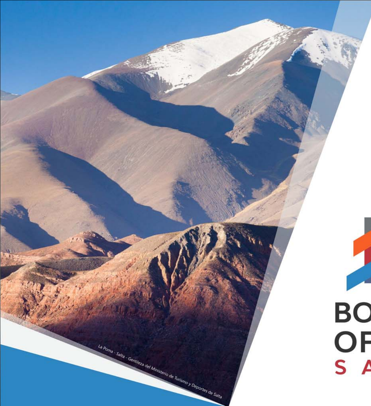
La Poma - Salta