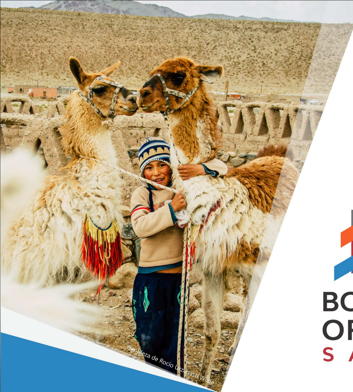
Gratía de Rocío Urzagasti Wilde