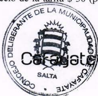
PRESIDENTE CONCEJO DELIBERANTE MUNICIPALIDAD DE CAFAYATE