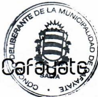
VICEPRESIDENTE CONCEJO DELIBERANTE MUNICIPALIDAD DE CAFAYATE