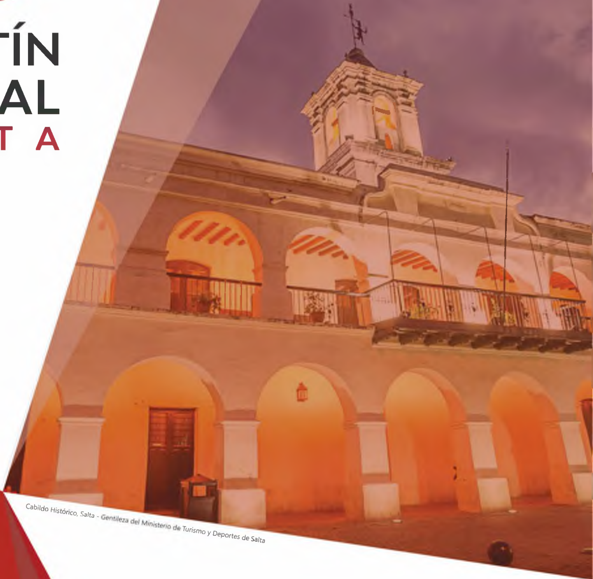
Cabildo Histórico, Salta