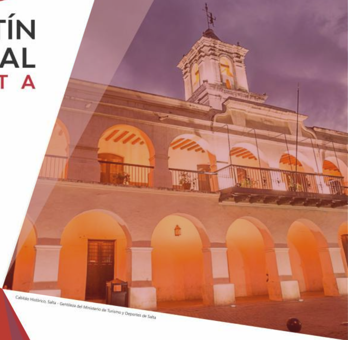
Cabildo Histórico, Salta