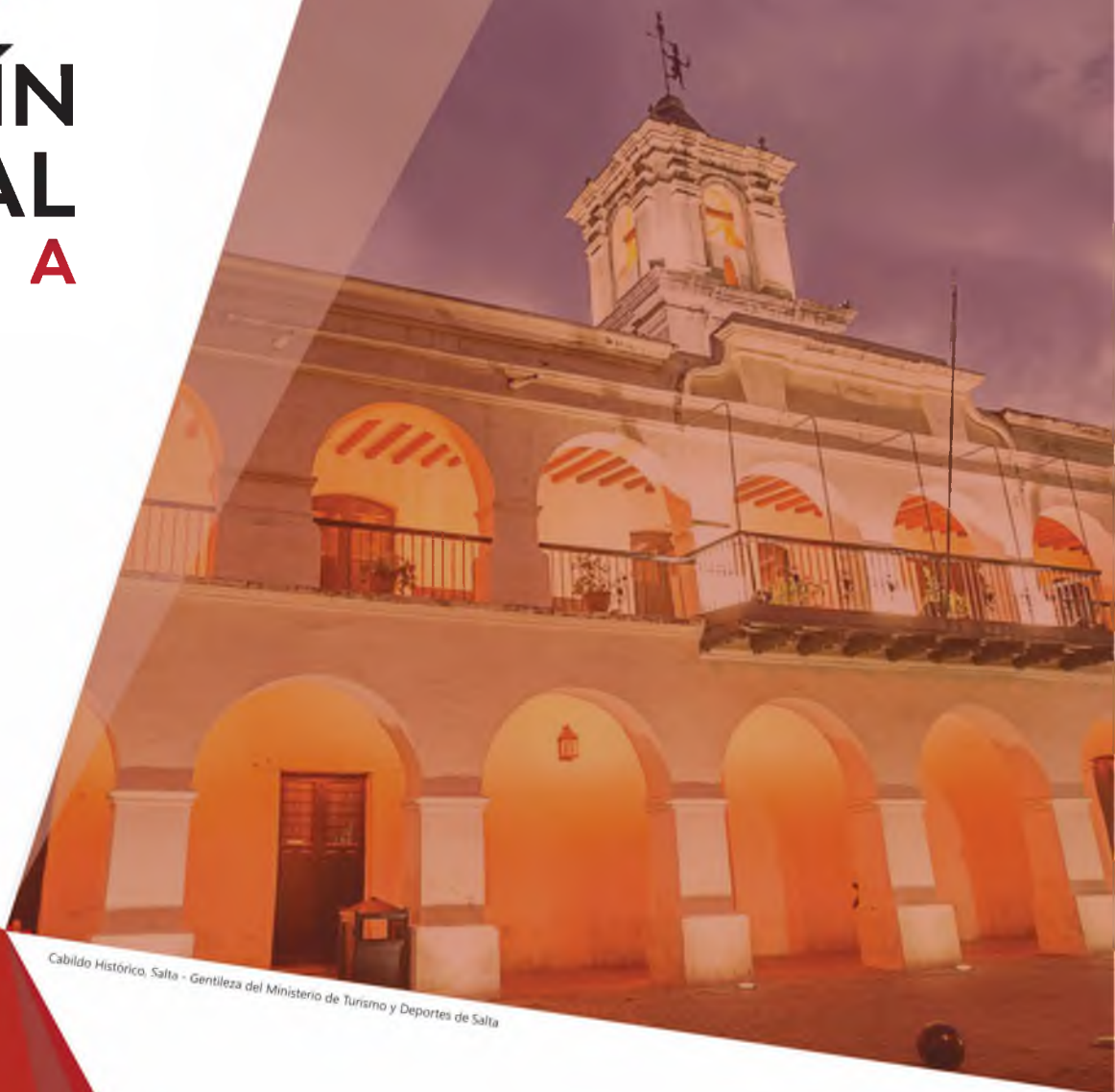
Cabildo Histórico, Salta