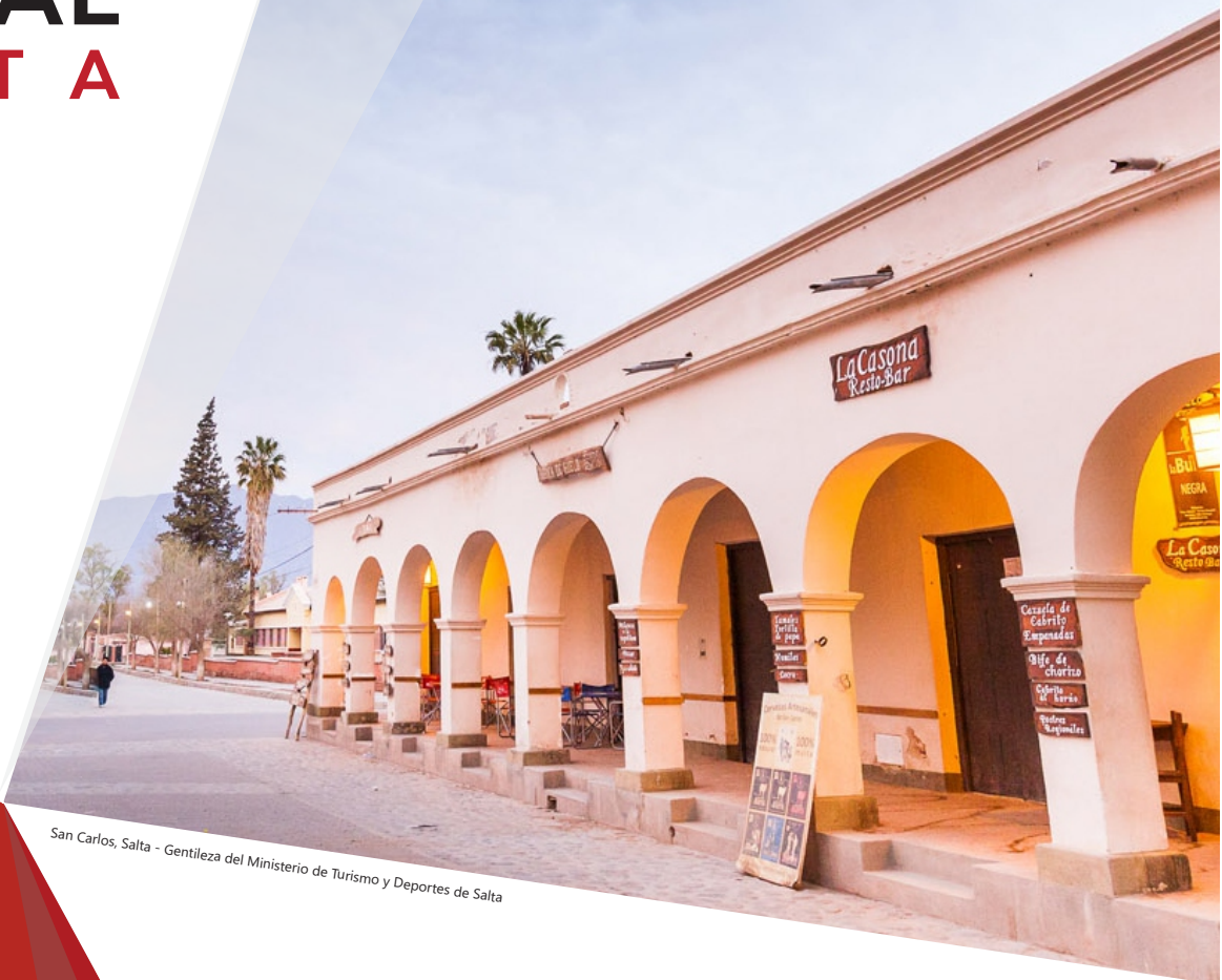
San Carlos, Salta