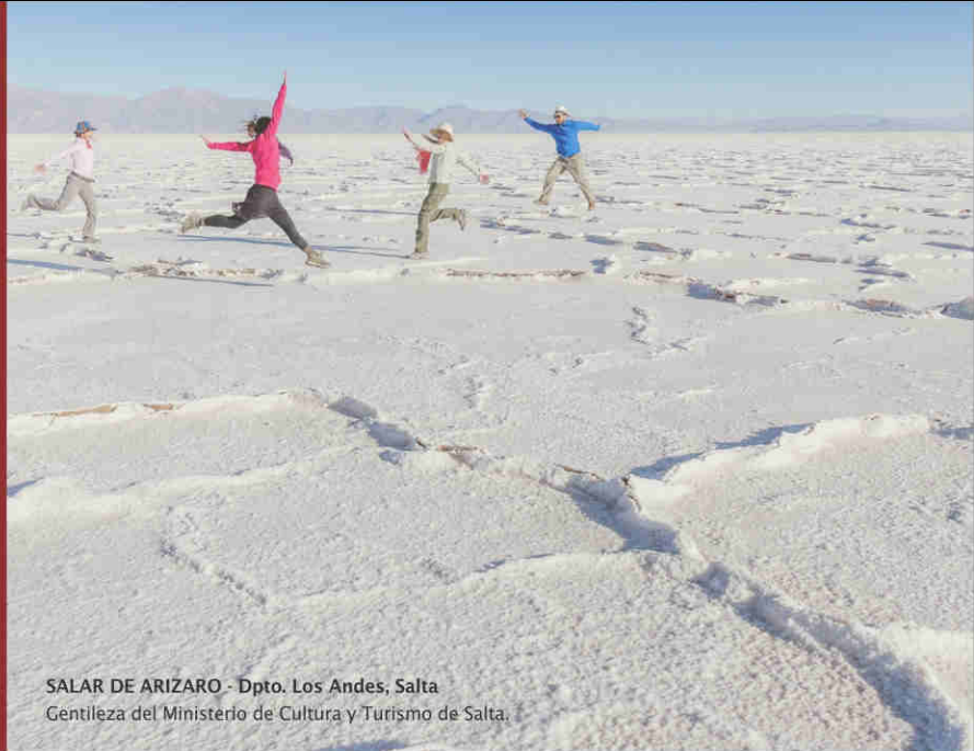
SALAR DE ARIZARO - Dpto. Los Andes, Salta