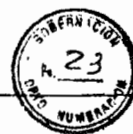
TABLA 3: Para Protección de Vida Acuática en Aguas Saladas Superficiales